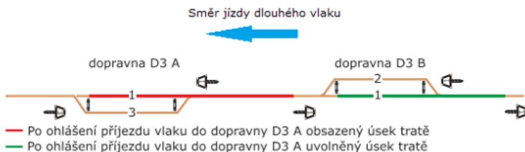
obrázek 4 – Jízda dlouhého vlaku