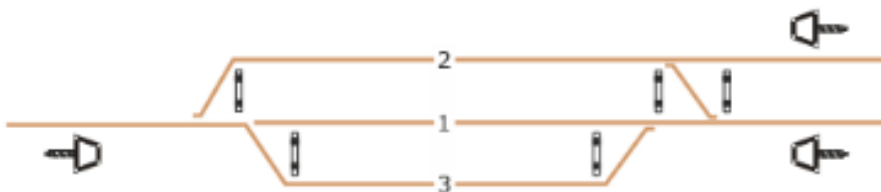
obrázek 3 – Dopravna D3 se zaústěním dvou traťových kolejí do jednoho zhlaví