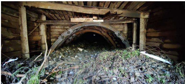
Naplavenie zeminy do vnútra priepustu.