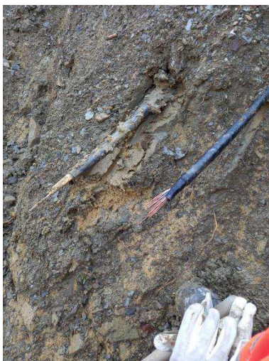
Pretrhnutie kábla 6kV medzi TS 3012 a TS 3013 skriňami.