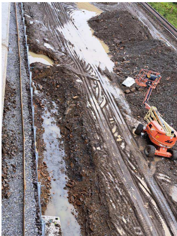
Vykopaná ryha pre odvodňovacie žľaby.