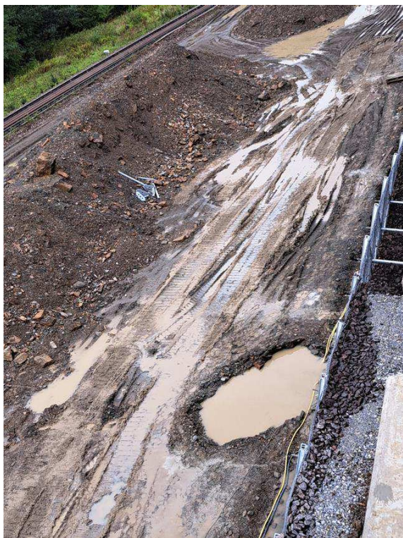
Vykopaná ryha pre odvodňovacie žľaby.